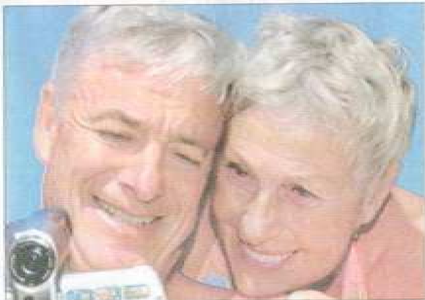
■ Pour les Français, les seniors devraient avoir des rôles à jouer.

A quel âge entre-t-on dans la vieillesse ? Le premier enseignement de l'enquête sur la place des seniors dans la société française dont nous publions aujourd'hui, en avant-première, les résultats (*) ne manque pas d'amuser. Plus on est jeune, plus le moment de la bascule est précoce ! Ainsi les 18-24 ans considéraient qu'une personne devient « âgée » à 60 ans et des poussières quand les septuagénaires mettent la barre à presque 76 ans. L'allongement de la durée de vie redonne une nouvelle jeunesse à ceux que l'on appelle encore il y a peu les « vieux ». C'est sur l'âge de la retraite que les générations - toutes tranches confondues - se retrouvent : les jeunes adultes la voient arriver vers 62 ans et demi, tandis que les quinquagénaires (50 - 59 ans) la situent à 62 ans. Ce sont les plus de 60 ans qui logiquement la repoussent au delà. Quant aux retraités interrogés, ils confirment à quelques jours près la réalité de l'âge légal de la retraite qu'ils ont prise à 59,9 ans.